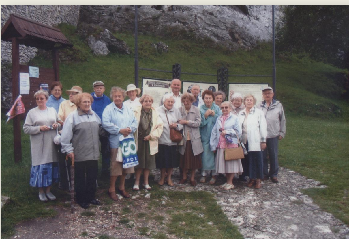
Zjazdy absolwentów Absolwenci studiów rolniczych, którzy rozpoczynali studia w 1946 roku. Profesor z żoną (trzecia od prawej) na spotkaniu koleżeńskim, Ojców, 2007 rok