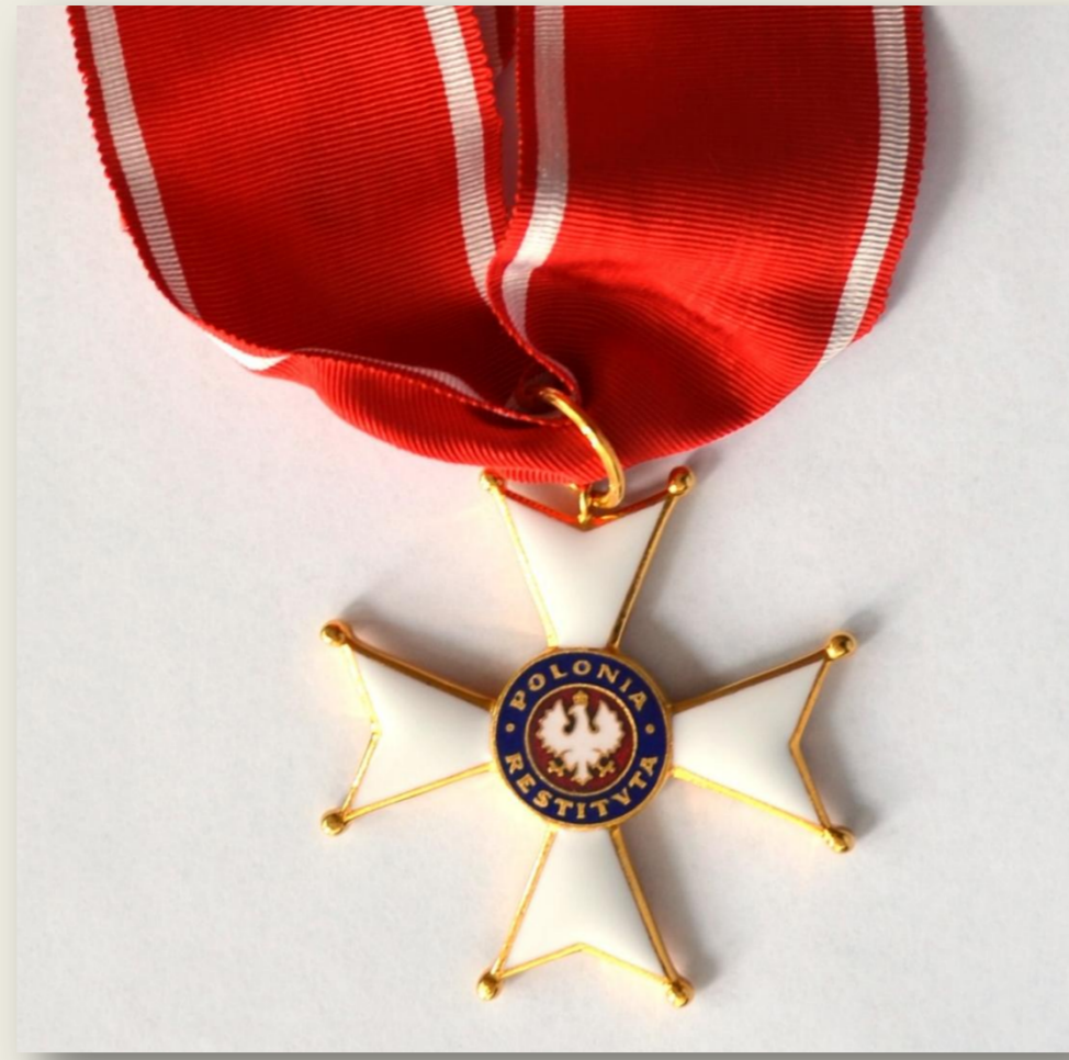
Polonia Restituta Krzyż Komandorski Orderu Odrodzenia Polski