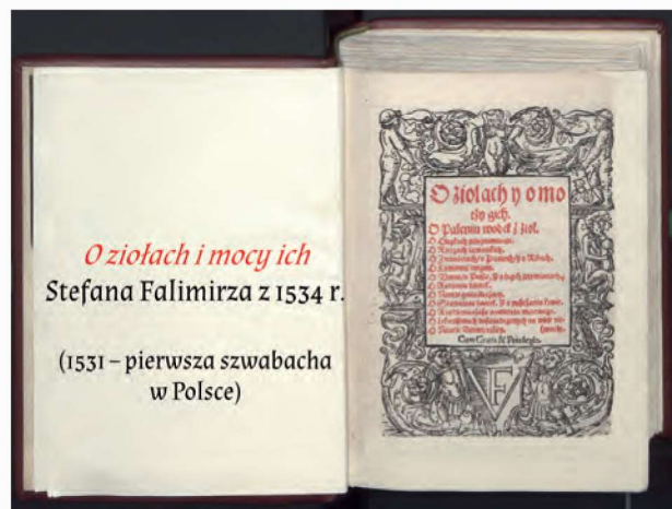
O ziołach i mocy ich Stefana Falimirza z 1534 r.

W zajęciach wykorzystujemy prezentację multimedialną, materiały filmowe i interaktywny quiz.